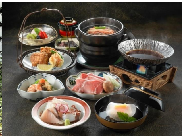
日本料理「あわみ」七福神会席